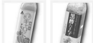
アジア食品 生キヤロット ドレッシング 200ml