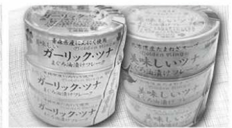
伊藤食品 ・美味しいツナ(油漬・オイル無添加) ・ガーリックツナ 70g×3缶入・各1パック