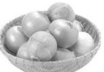
佐賀県産他 新たまねぎ 100g当り