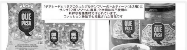
クバサ オーガニックトルティーヤチップス ・サチョ・ハラペーニョ&ライム ・スイート&スパイシー 通常640円の商品 各156g