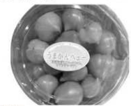
埼玉県産 高糖度トマト 「うまかんペー」 1パック