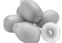
ニュージーランド産 ゴールドキウイ 1個