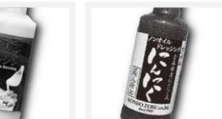
近藤造酢 プレミアムチーズドレッシング 210ml