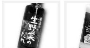
近藤造酢 蔵仕上げ生野菜のたれ 210ml