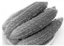
鹿児島県産 ゴヤー 特大1本