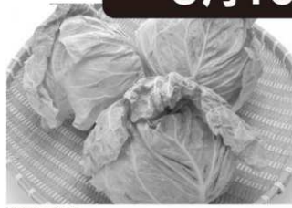
神奈川県産他 春キャベツ 1個