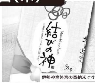
ミエライス 結びの神 5kg