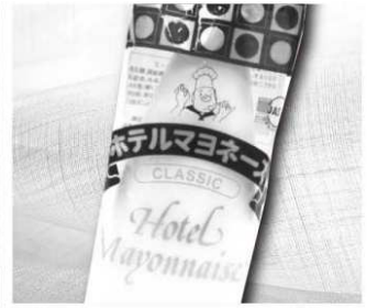
丸和 ホテルマヨネーズ クラシック 400g