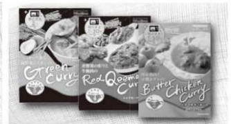
・赤野菜の彩り牛挽肉のレッドキーマカレー ・ココナッツ曲る緑野菜のグリーンカレー ・国産鶏肉とトマトのバターチキンカレー