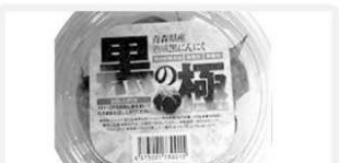
エイト 青森熟成黒にんにく 「黒の極」100g