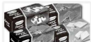
クワンマスター パウンドケーキ各種 ・オレンジキユール・ジャマイカラム ・ティラミスフレーバー・チェリーブランド 通常580円の商品 各400g