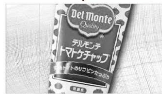
デルモンテ トマトケチャップ 800g