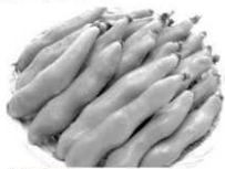
福岡県産他 そろまめ 1パック