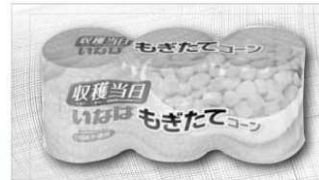
いなば もぎたてコーンホール 200g×3缶入・1パック